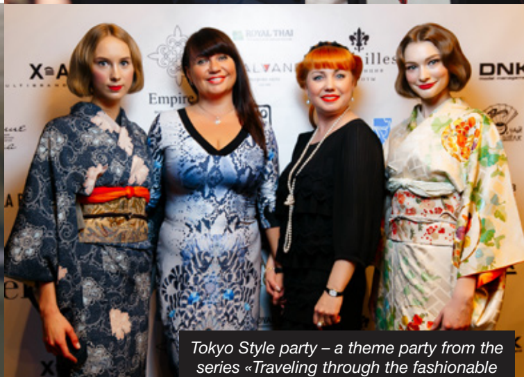
Tokyo Style party – a theme party from the series «Traveling through the fashionable capital of the world»