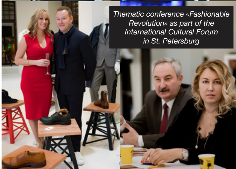
Thematic conference «Fashionable Revolution» as part of the International Cultural Forum in St. Petersburg

DRESS CODE Agent, a subsidiary, creates and delivers unique corporate events and brand experiences.