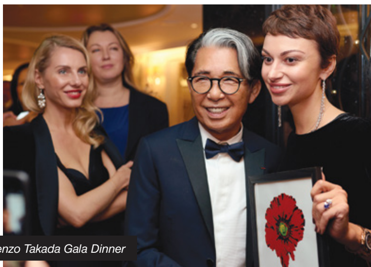
Kenzo Takada Gala Dinner

EXHIBITIONS COCKTAIL RECEPTIONS FASHION SHOWS DINNERS ROUND TABLES