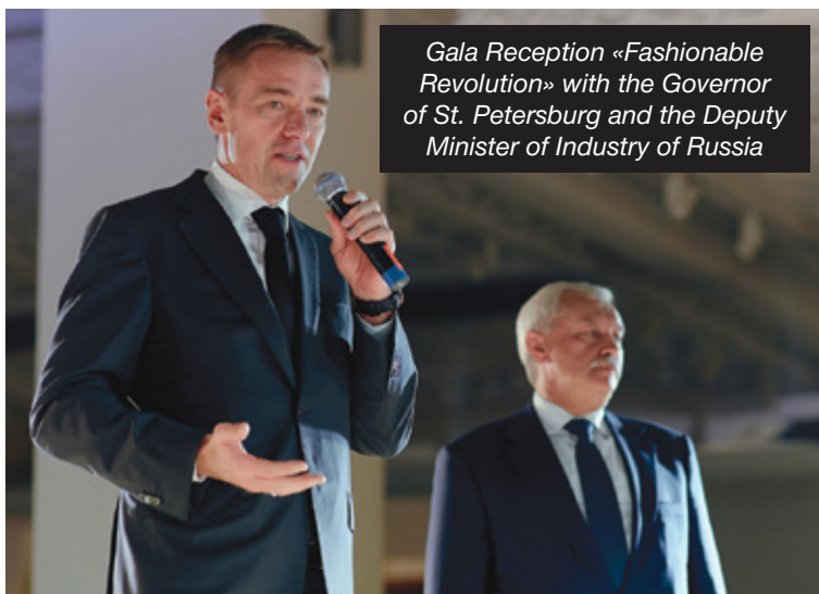
Gala Reception «Fashionable Revolution» with the Governor of St. Petersburg and the Deputy Minister of Industry of Russia